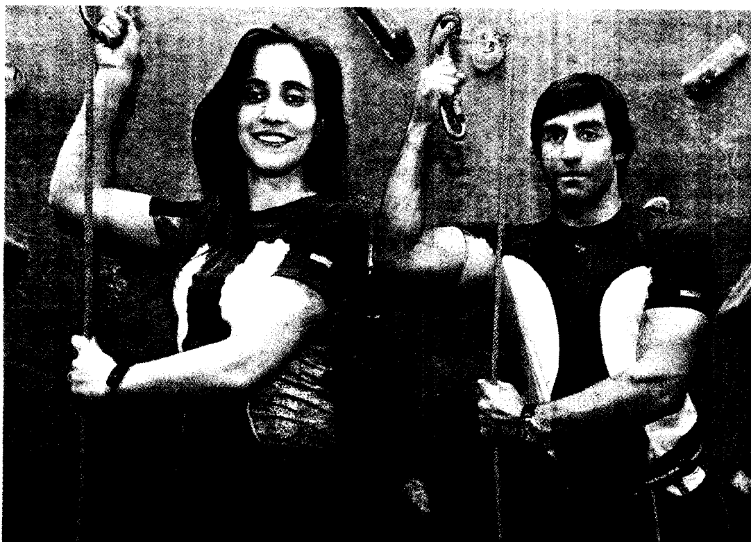
À 'T-shirt' cinzenta juntaram-se depois as mais coloridas, apelando ao universo feminino

Com a certificação médica concluída, novos modelos surgirão, com